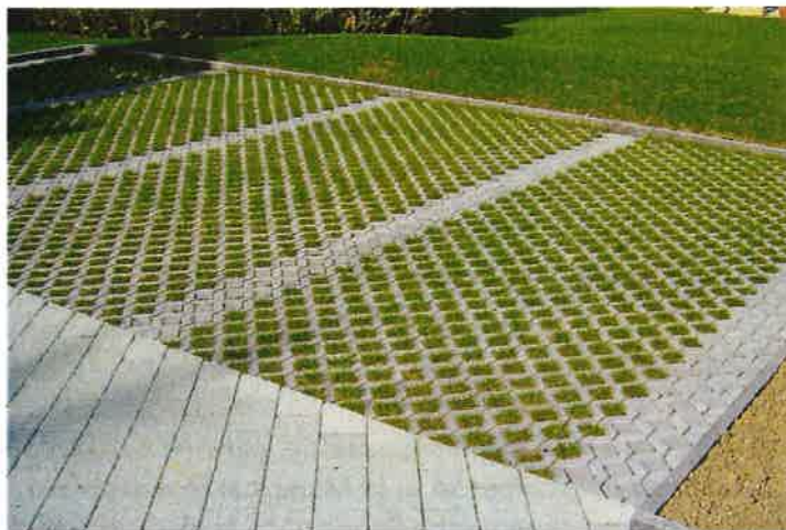
Figure 2: exemple de grilles gazon

Durabilité et résistance : Les grilles gazon peuvent supporter le poids des véhicules, ce qui en fait une solution viable pour les allées, les zones de stationnement et autres zones à trafic.