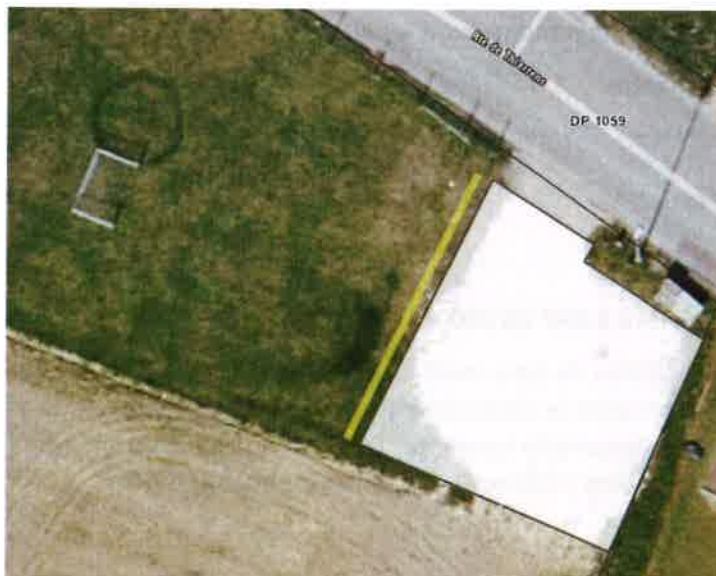
Figure 1: zone de stationnement

Le projet doit permettre de créer des nouvelles places de stationnement publiques sur une zone d'environ 150m 2 , et ce précisément à l'Est de la place de jeu, sur la parcelle communale 363, zone affectée à des besoins publics 15 LAT.